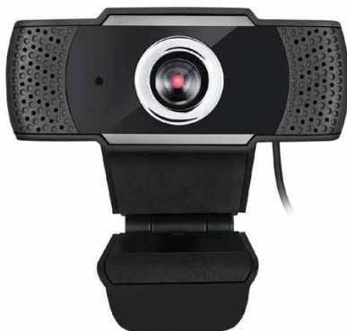
Модел: Cybertrack H4 www.adesso.com